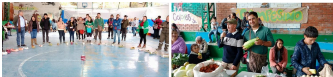
Acciones de participación y educación adelantadas en la Localidad de Sumapaz

Se realizaron cuatro actividades clave, que incluyeron la identificación de los participantes en el territorio, invitándolos a formar parte activa del proceso, promover sus hábitos y costumbres saludables en los mercados campesinos, y compartir experiencias en los espacios de participación donde esta población ya está presente de manera habitual en la localidad.