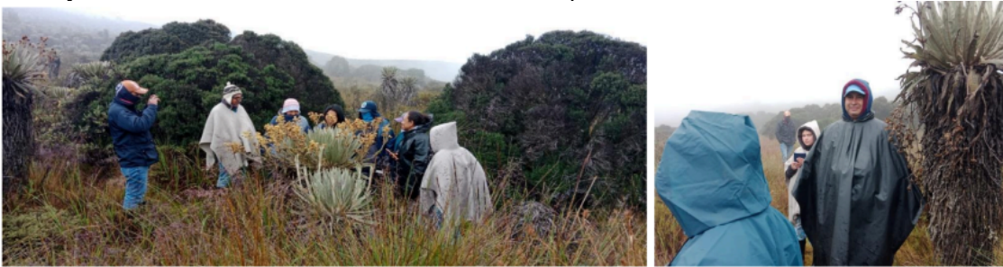
Proceso de Participación

Se llevaron a cabo cinco acciones clave, destacándose mesas de trabajo, recorridos para el reconocimiento de flora y fauna nativa, talleres teóricos-prácticos sobre el reconocimiento de especies invasoras, y un cine foro con la comunidad vinculada al proceso.