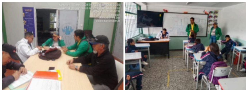
Proceso de Participación