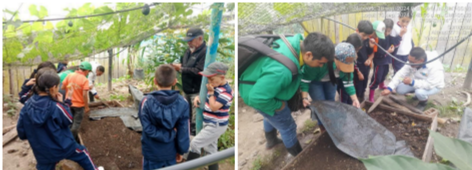
Proceso de Participación

Se realizaron cinco actividades, que incluyeron capacitaciones y trabajo en campo para la producción de bioabonos a partir de residuos sólidos orgánicos, así como un campo de lombricultura para la generación de humus.